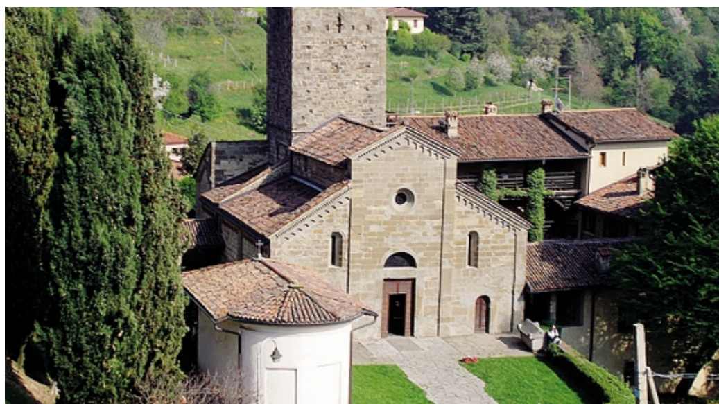
L'Abbazia di Fontanella di Sotto il Monte ospita questa sera un incontro di «Molte fedi»

A fabricà e litigà a s' consòma quel che s' gh' à A fabbricare e litigare si consuma quello che si ha